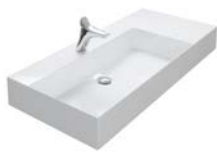
KERAMIK ASYMMETRISCH 810 | 1020 | 1220 MM