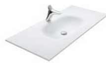
SOLID SURFACE 600 | 800 | 1020 | 1220 | 1420 | 1612 MM