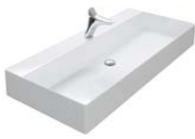
KERAMIK 600 | 800 | 1020 | 1220 | 1420 | 1612 MM